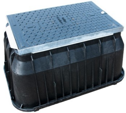
SW-brunn med tillhörande B125 lock