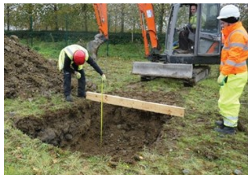
Kontroll av urgrävningsdjup

Tips! Lägg en regel över schaktgrop för att enklare kontrollera urgrävningsdjupet.